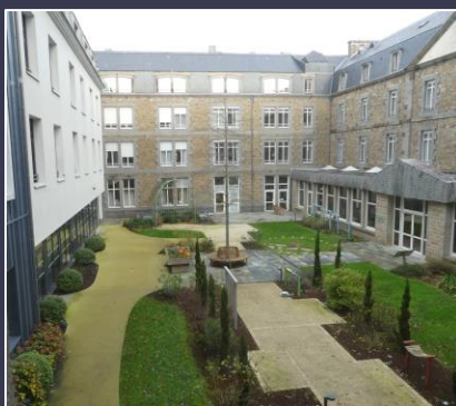
Répartition géographique page 8